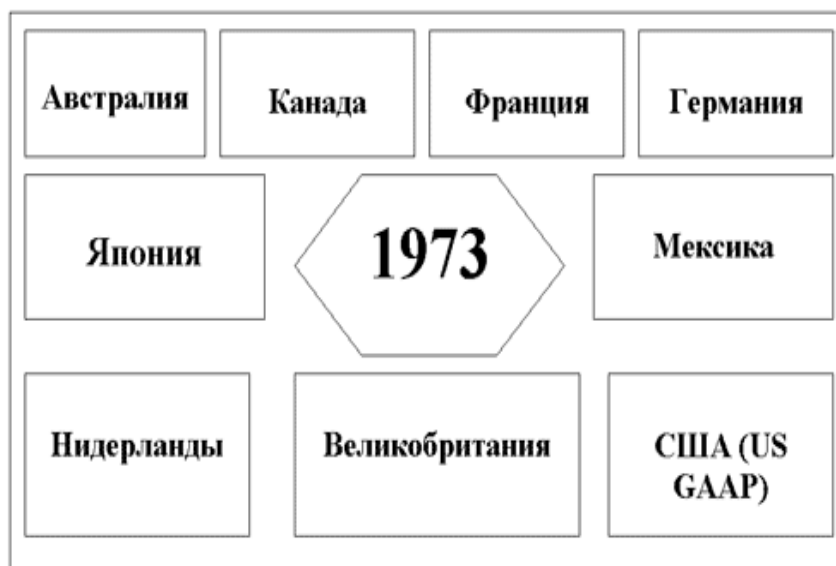
Рис. 1. Создатели КМСФО

Комитет по Международным стандартам финансовой отчетности, или, Комитет по Международным бухгалтерским стандартам был создан профессиональными бухгалтерскими организациями ряда стран как независимый орган частного сектора в 1973 году. С 1981 года КМСФО был полностью автономным во внедрении международных стандартов финансовой отчетности и в вопросах обсуждения документов, касающихся международного учета.